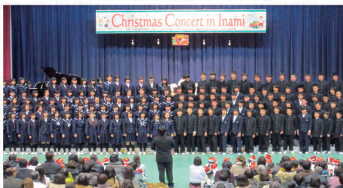
クリスマスコンサート（平成25年12月25日）