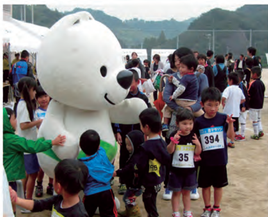
第33回豆マラソン（平成25年11月3日）