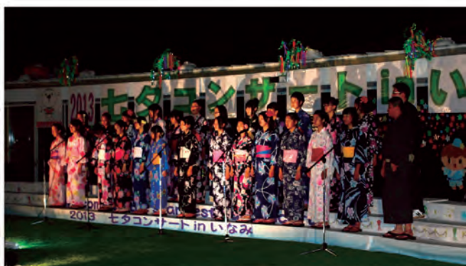
七タコンサート（平成25年7月13日）