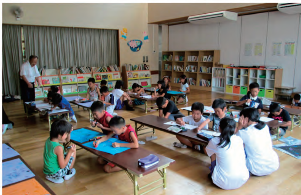
放課後子ども教室（印南・平成25年8月1日）