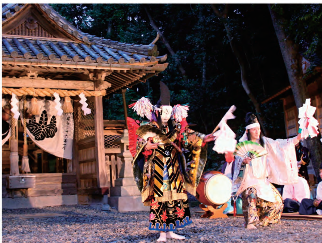
石見神楽（印南町文化協会40周年記念行事）