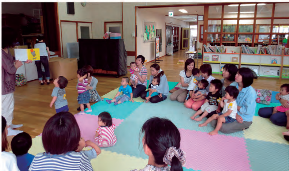
ひまわり教室（平成25年6月21日）

特に子どもが親に寄せる思いをしっかりと受け止められ、親子の愛情交歓ができる親育てに努めます。