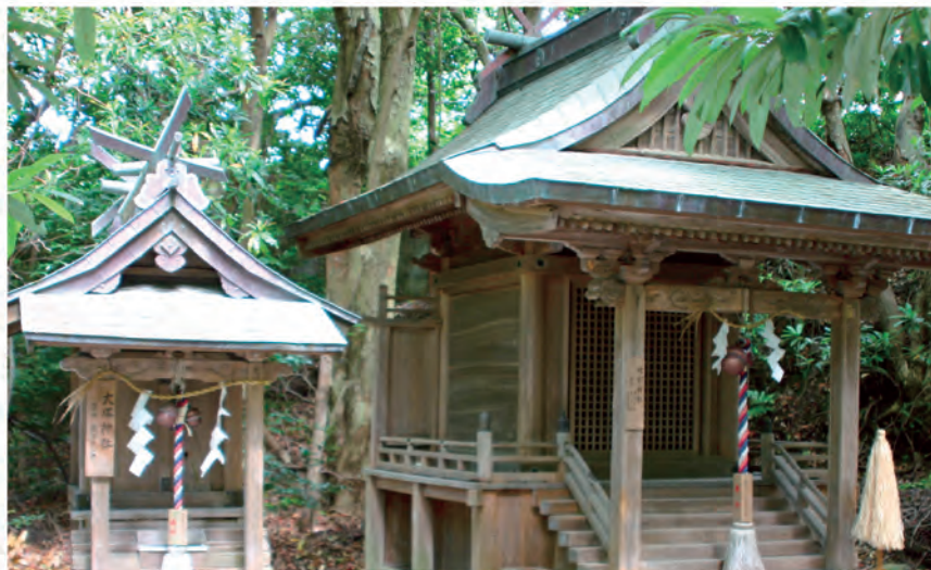
県指定文化財 切目王子の祠

社会教育では、生涯学習のまちづくりをめざして、住民の自主的な社会参加活動を支援するとともに、多様化・高度化する学習ニーズを把握し、学習機会の確保、学習情報の提供を充実し、印南町の恵まれた「自然」「歴史」「文化」などの学習資源を有効活用して人間性豊かなまちづくりを目指します。