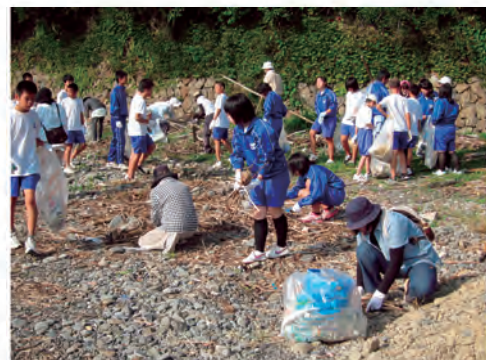
シーサイドクリーン作戦（平成25年10月12日）