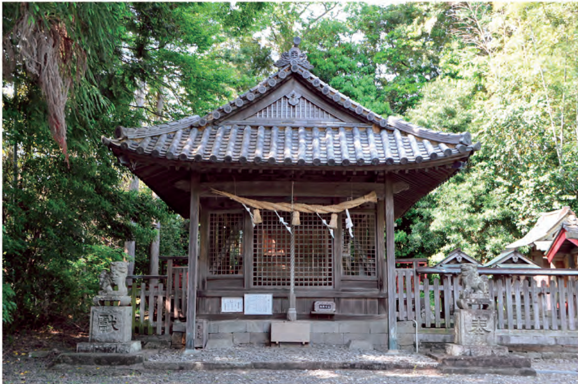
中山王子（県指定文化財）