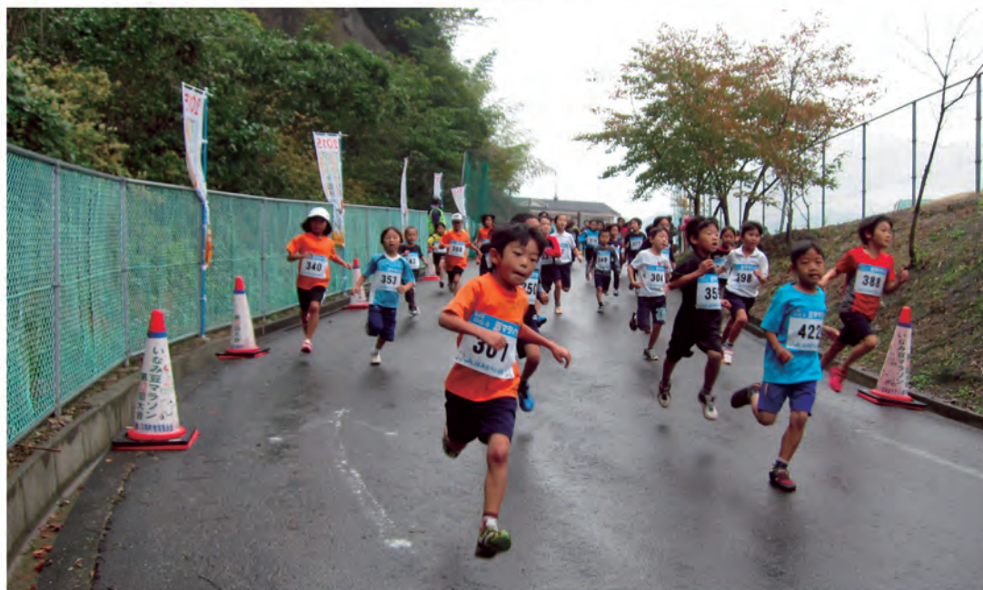
第33回豆マラソン（平成25年11月3日）