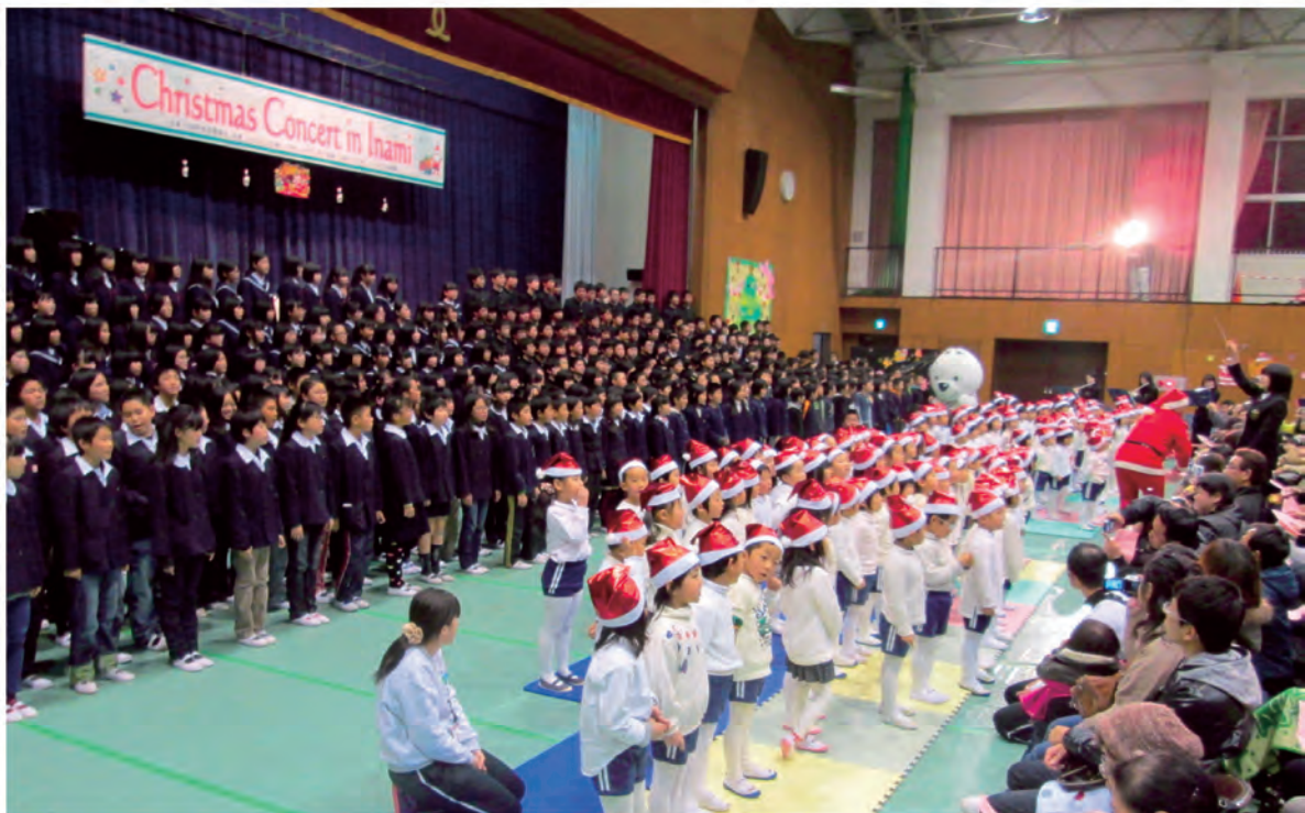
第4回クリスマスコンサート（平成25年12月25日）

特に公民館は生涯学習の活動拠点として更なる積極的な活動を展開していくとともに、各種団体の活動を積極的に支援していきます。