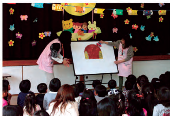
おはなし会（平成25年4月21日）