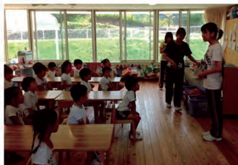
園小連携職員研修（平成25年8月27日）