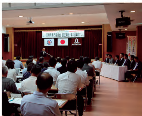
紀の国わかやま国体印南町実行委員会総会 （平成25年6月7日）