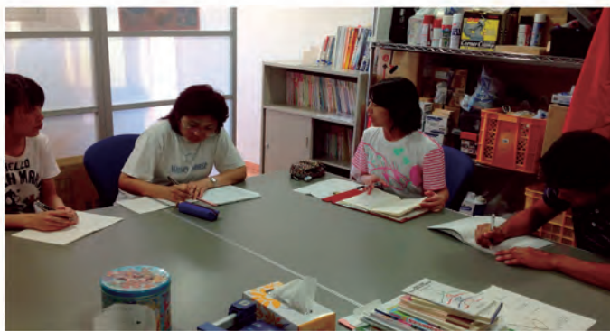
いなみこども園・小学校職員研修（平成25年8月27日）