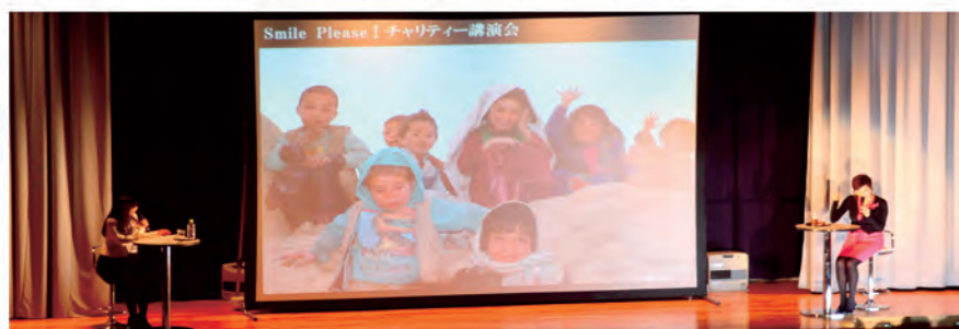
人権教育講演会 (平成26年2月28日)

全国的に児童虐待(育児放棄等も含む)など子どもの人権に関わる問題が深刻化している中、子どもや保護者等が気軽に相談できる体制づくりを進めます。