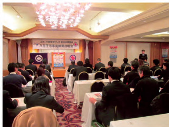
東京国体事業概要説明会（平成25年12月19日）