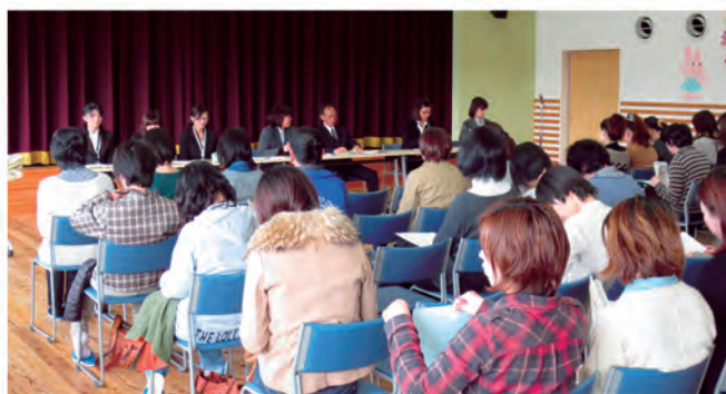
いなみこども園入園説明会（平成25年2月1日）

保育士等処遇改善事業 延長保育促進事業 認定こども園園児委託事業 認定こども園運営費補助事業