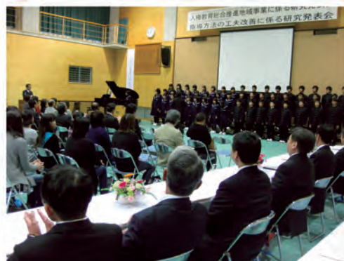
研究発表会(切目中学校・平成25年11月6日)