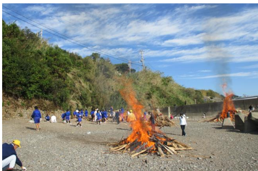
シーサイドクリーン作戦（平成26年10月18日）