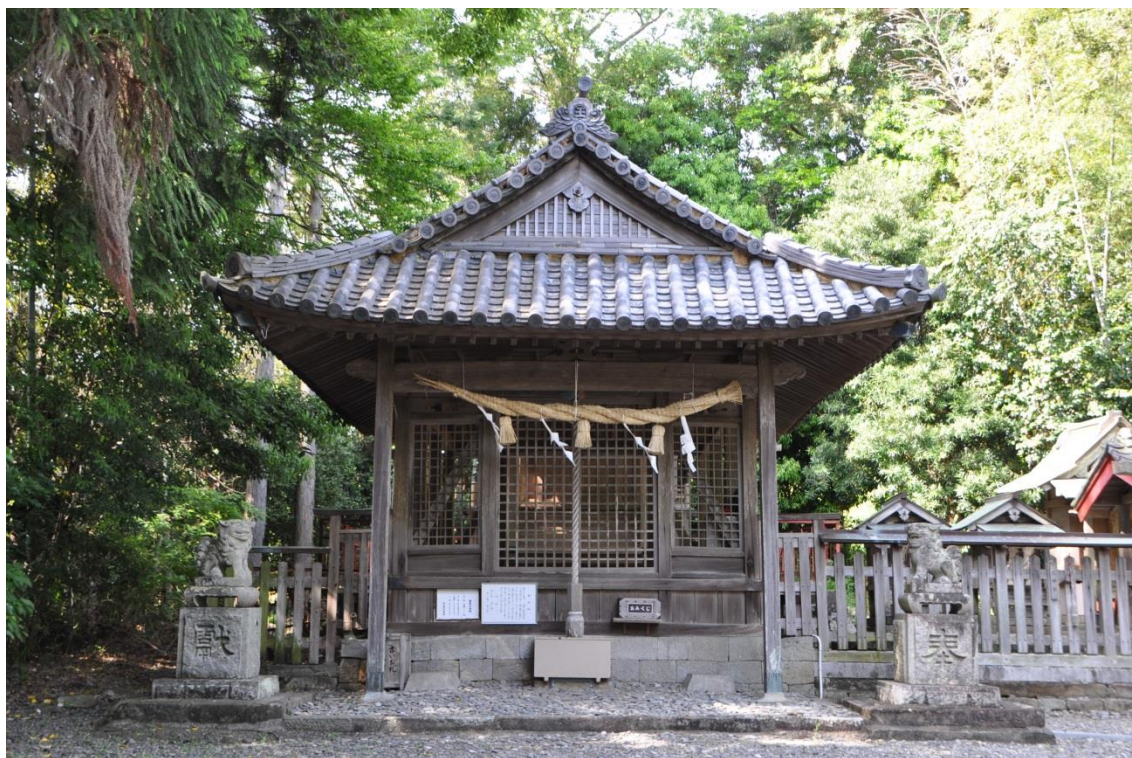
中山王子（県指定文化財）