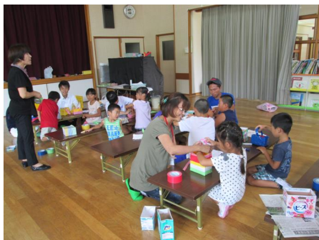
放課後子ども教室（印南・平成26年8月7日）