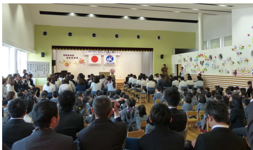
いなみこども園入園式（平成26年4月5日）