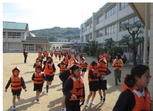
防災訓練（印南小学校・平成26年4月23日）