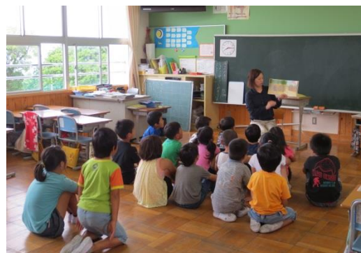
こども園・小学校職員研修（平成26年6月26日）