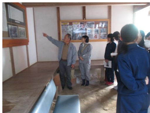
切目中学校地域文化学習