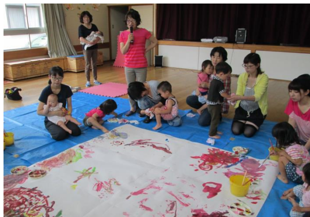
ひまわり教室（平成26年7月18日）

特に、子どもが親に寄せる思いをしっかりと受け止められ、親子の愛情交歓ができる親育てに努めます。