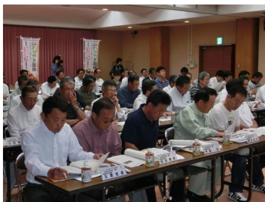
紀の国わかやま国体印南町実行委員会総会 (平成26年5月29日)