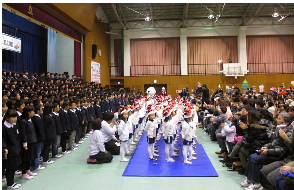
第5回クリスマスコンサート（平成26年12月25日）

特に公民館は生涯学習の活動拠点として更なる積極的な活動を展開していくとともに、各種団体の活動を積極的に支援していきます。