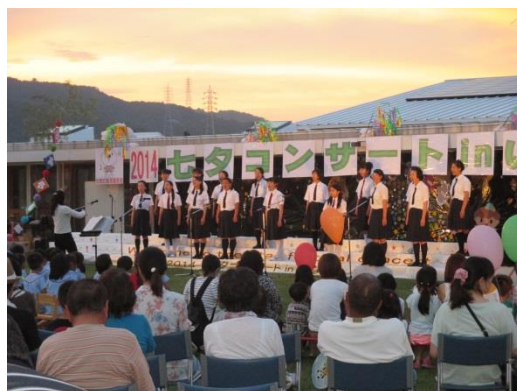
七夕コンサート（平成26年7月12日）