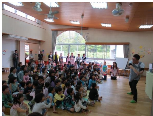
おはなし会（平成26年4月26日）