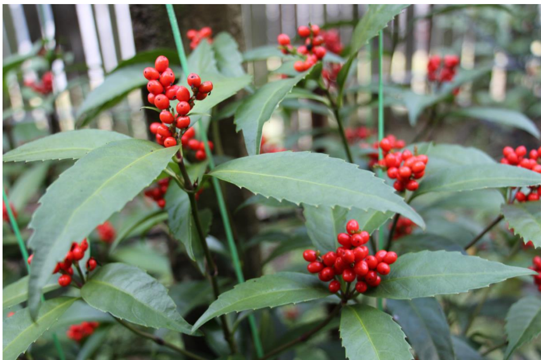
千両（印南町真妻地内）