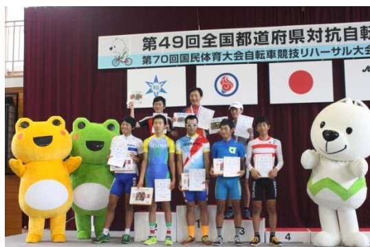
自転車競技リハーサル大会 (平成26年8月24日)