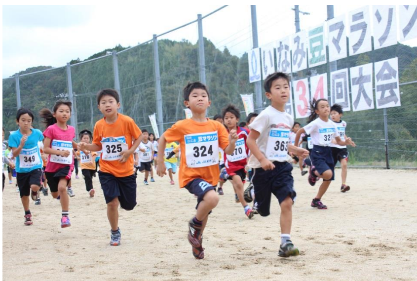
第34回豆マラソン（平成26年11月2日）