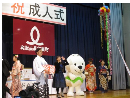
印南町成人式（平成27年1月11日）