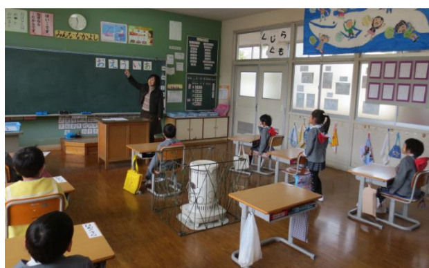
小学校体験入学（清流小・平成27年2月24日）