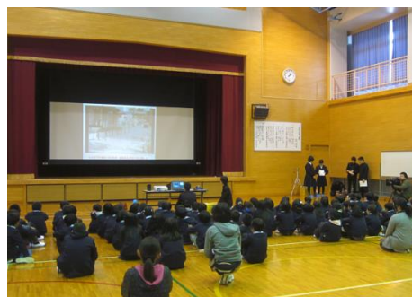
中学生による防災出前授業 (印南小・平成29年1月12日)