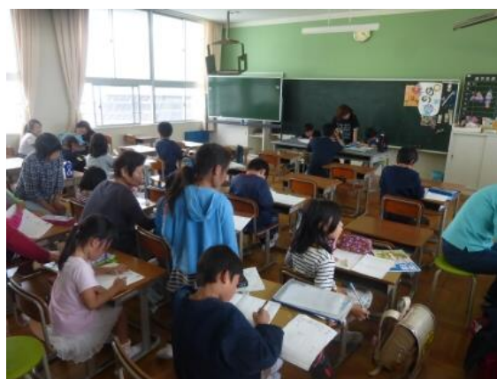
放課後子ども教室（平成28年5月17日）