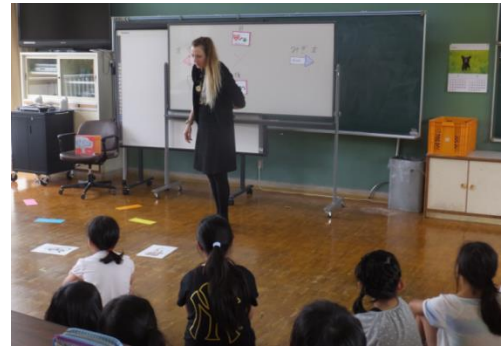
授業風景（清流小4年・平成28年5月30日）