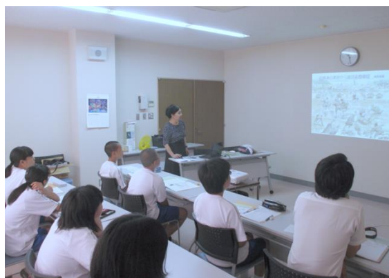
歴史学習（清流中・平成28年8月17日）