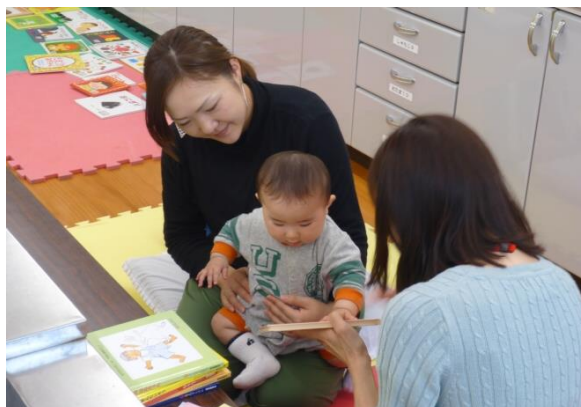
ブックスタート（平成29年4月17日）