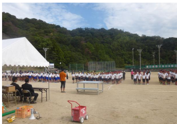
小学校連合運動会（平成28年10月13日）