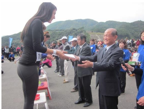
いなみまめダムマラソン（平成28年11月6日）