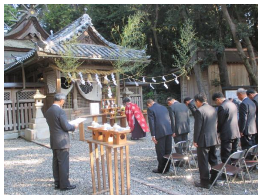
切部王子跡安全祈願祭（平成29年1月10日）