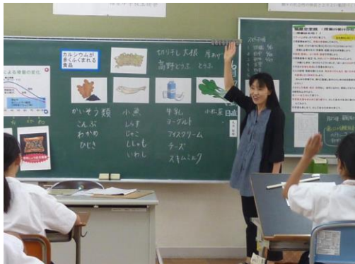
栄養教諭による食育指導 (稲原中・平成28年6月)

すべての小中学校において、食に関する指導の全体計画に基づき、栄養教諭が中心となり学校給食を生きた教材として「食」に関する指導の充実を図ります。地域の自然や環境、郷土食や和食への理解を深めます。