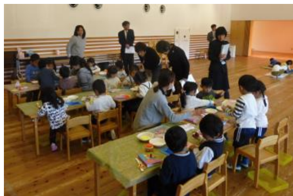
いなみこども園教育委員訪問（平成29年2月28日）