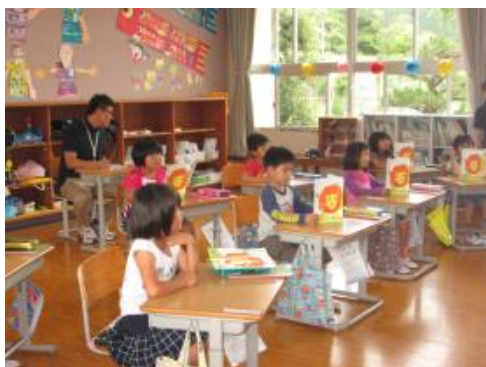
園小連携事業（稲原小・平成28年 6月13日）

また、幼児期の教育は、生活習慣をはじめ保護者の意識に依存するところが大きいので、保護者の教育力の向上を同時に進める必要があります。保護者・地域の教育力を高めるため、就学前の子ども達の交流機会を拡大し、保護者や地域の人たちが共に学び交流する場を充実させるとともに、地域の人材活用（支援ボランティア等）促進も併せて推進します。