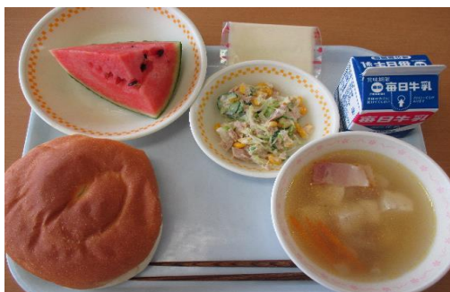
地元のスイカを給食に提供（切目中）

自校調理の特色を活かし、学校給食に地産地消による質の高い食材を取り入れ、郷土食等や和食を推進し、地域の生産者や生産過程について理解を深めるとともに、食への感謝と大切に作る気持ちを育みます。また、作り手の顔が見える安心で温かい給食実施のため、調理員の研修や処遇改善による優秀な人材確保に努めます。