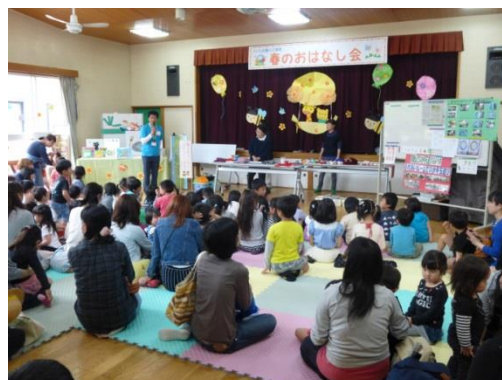
春のおはなし会（平成28年4月22日）