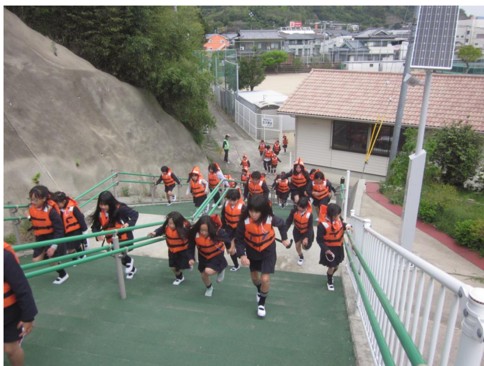
印南小学校での津波避難訓練