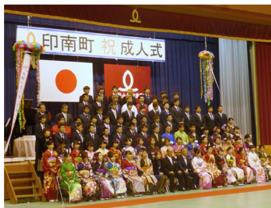
成人式（二十歳の集い）事業（平成29年1月8日）