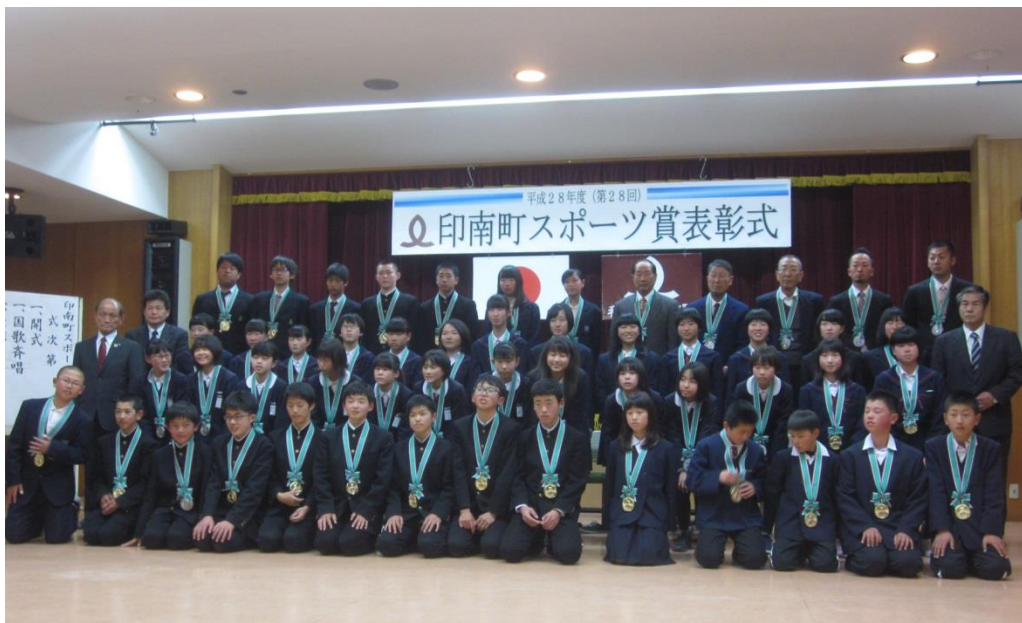
印南町スポーツ賞表彰式（平成29年3月21日）

文化に触れ合う機会の創出と情報発信の充実を図り、より多くの人に関心を持てるよう、学校教育や社会教育の場などを通じて、交流機会の創出に努めていきます。