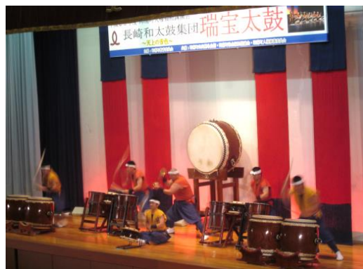
人権福祉講演会（平成28年12月9日）