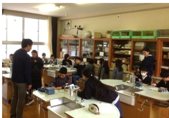
小学校体験入学（清流小・平成29年2月23日）