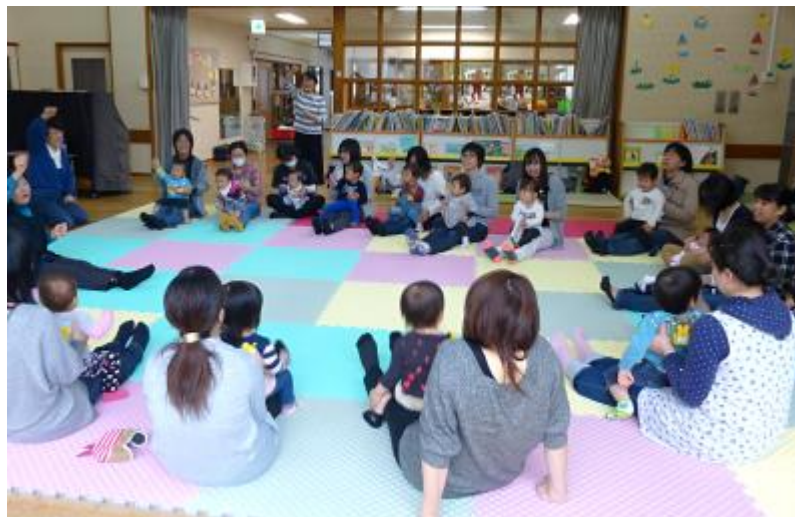
ひまわり教室（平成29年4月21日）

国における子ども・子育て関連3法の成立により、平成27年4月から『子ども・子育て支援新制度』が施行されました。本町では、「子育てするなら印南町」の実現を目指して、子育て支援・育児環境の充実を図り、子どもを取り巻く家庭、地域が共に支え育ちあい、成長しながら、すべての子どもの笑顔が輝くまちづくりを推進します。家庭教育に関する学習機会の提供や子育てサークルの育成支援などを通して、生き生きと親子がふれあい、子どもが親に寄せる思いをしっかりと受け止められ、子どもへ注ぐ愛情を確かめ合えるよう進めます。また、基本的な生活習慣の確立と健康な身体の育成の大切さへの認識を深めるとともに、家庭の教育力向上を進めて行きます。