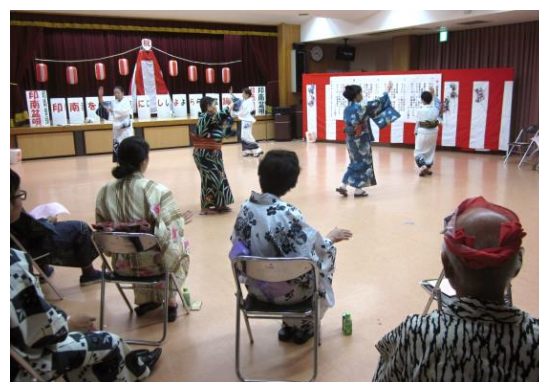
盆踊り（平成28年8月5日）