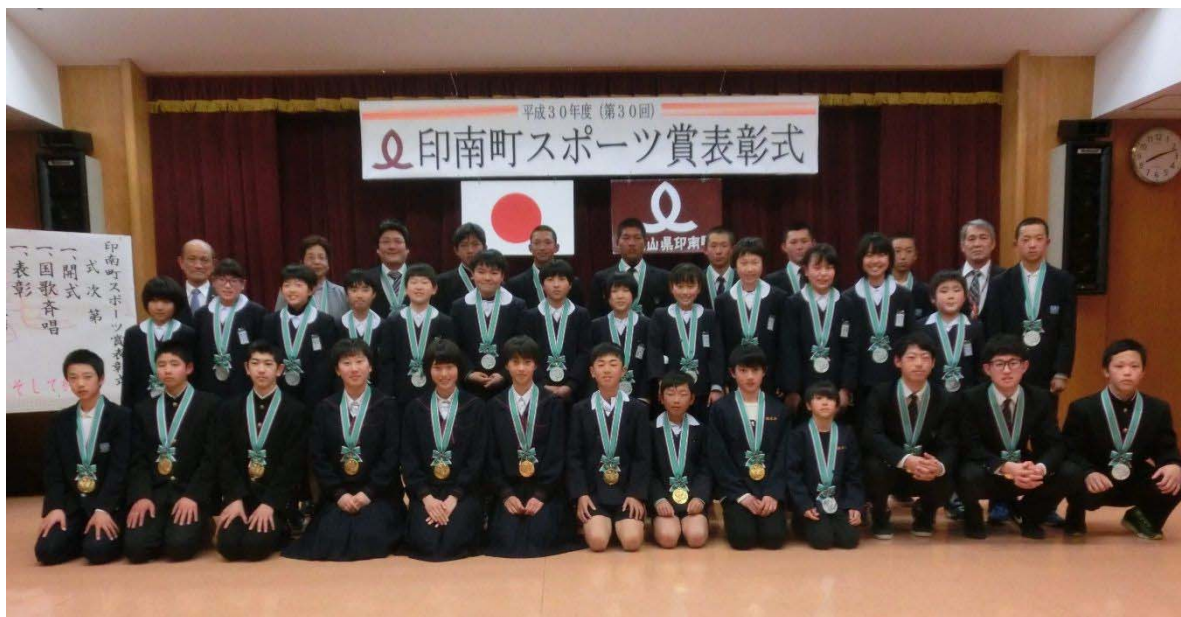
印南町スポーツ賞表彰式（平成31年3月18日）

文化に触れ合う機会の創出と情報発信の充実を図り、より多くの人に関心を持てるよう、学校教育や社会教育の場などを通じて、交流機会の創出に努めていきます。