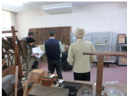
文化財保護審議会研修（平成31年3月26日）