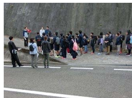
きりめっ子地域連携事業（地域防災学習） （切目小・中 平成30年10月13日）