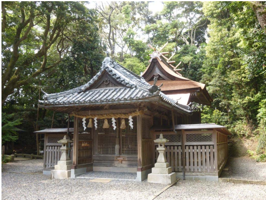
切部王子跡（県指定文化財）