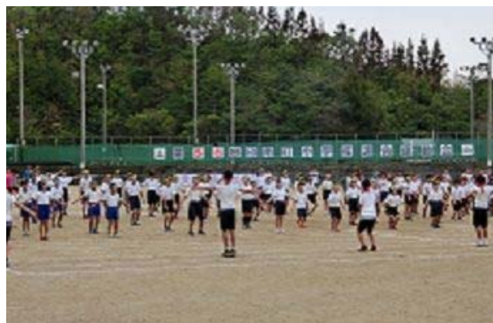
小学校連合運動会（平成30年10月10日）