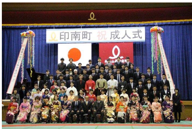
成人式（二十歳の集い）事業（平成31年1月13日）