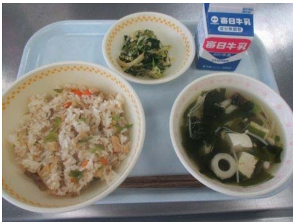
焼き鯖入り混ぜご飯、すまし汁、ごま和え

自校調理の特色を活かし、学校給食に地産地消による質の高い食材を取り入れ、郷土食等や和食を推進し、地域の生産者や生産過程について理解を深めるとともに、食への感謝と大切に作る気持ちを育みます。また、作り手の顔が見える安心で温かい給食実施のため、調理員の研修や処遇改善による優秀な人材確保に努めます。