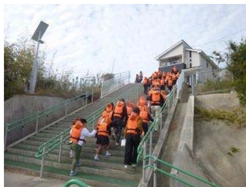
ライフジャケット活用防災避難訓練 (印南小・平成30年11月1日)