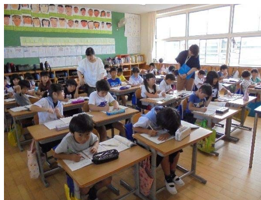
園小連携事業（切目小・平成30年6月12日）