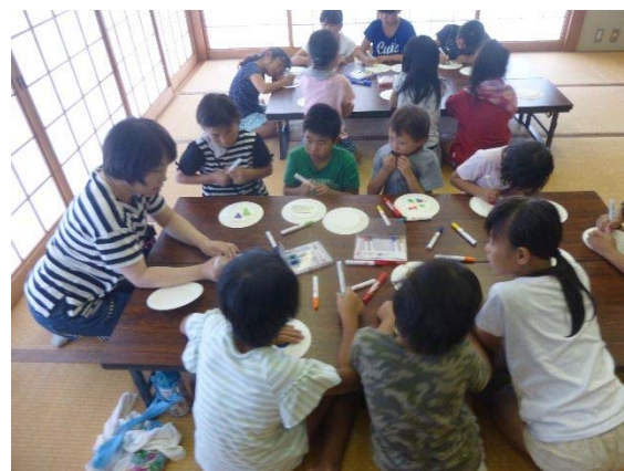
放課後子ども教室（平成30年8月9日）