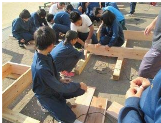
紀の国緑育推進事業（切目中・平成30年11月8日）