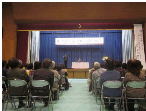
人権福祉講演会（平成30年11月30日）