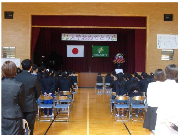
清流小学校入学式