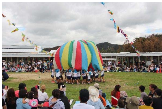
いなみこども園運動会（平成30年9月22日）