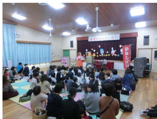
春のおはなし会（平成31年4月28日）