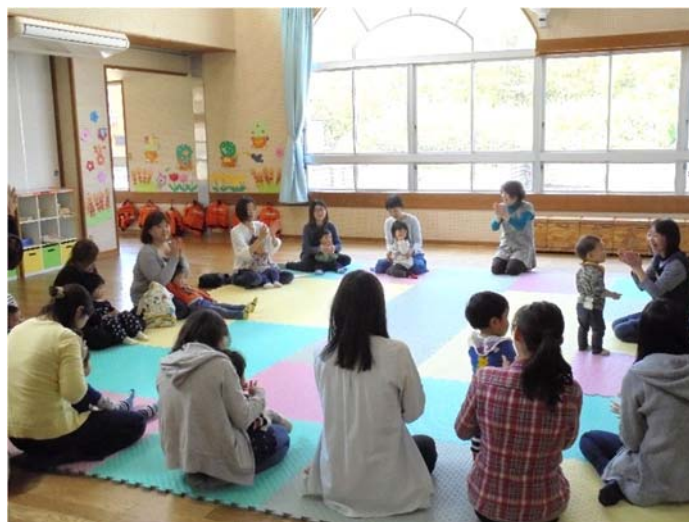
ひまわり教室（平成31年4月19日）

本町では、「子育てするなら印南町」の実現を目指して、子育て支援・育児環境の充実を図り、子どもを取り巻く家庭、地域が共に支え育ちあい、成長しながら、すべての子どもの笑顔が輝くまちづくりを推進します。家庭教育に関する学習機会の提供や子育てサークルの育成支援などを通して、生き活きと親子がふれあい、子どもが親に寄せる思いをしっかりと受け止められ、子どもへ注ぐ愛情を確かめ合えるよう進めます。また、基本的な生活習慣の確立と健康な身体の育成の大切さへの認識を深めるとともに、家庭の教育力向上を進めて行きます。