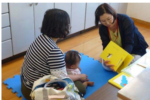
ブックスタート（平成30年8月3日）