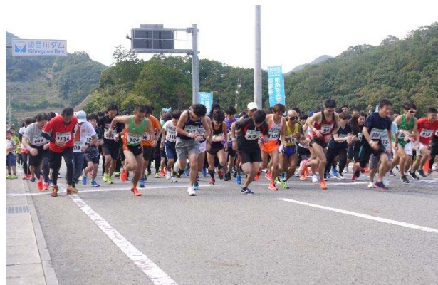
いなみまめダムマラソン（平成30年11月4日）