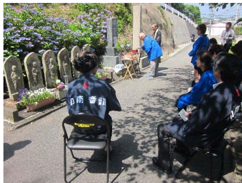
東光寺印南音頭奉納式（平成30年6月9日）