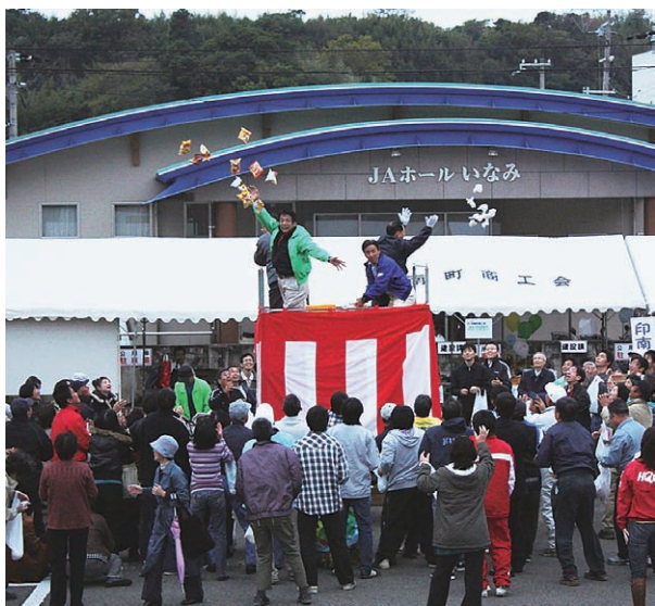
この日最後のイベントの餅まき。 会場内の4カ所に建てたやぐらから一 斉に餅まきがスタートしました。