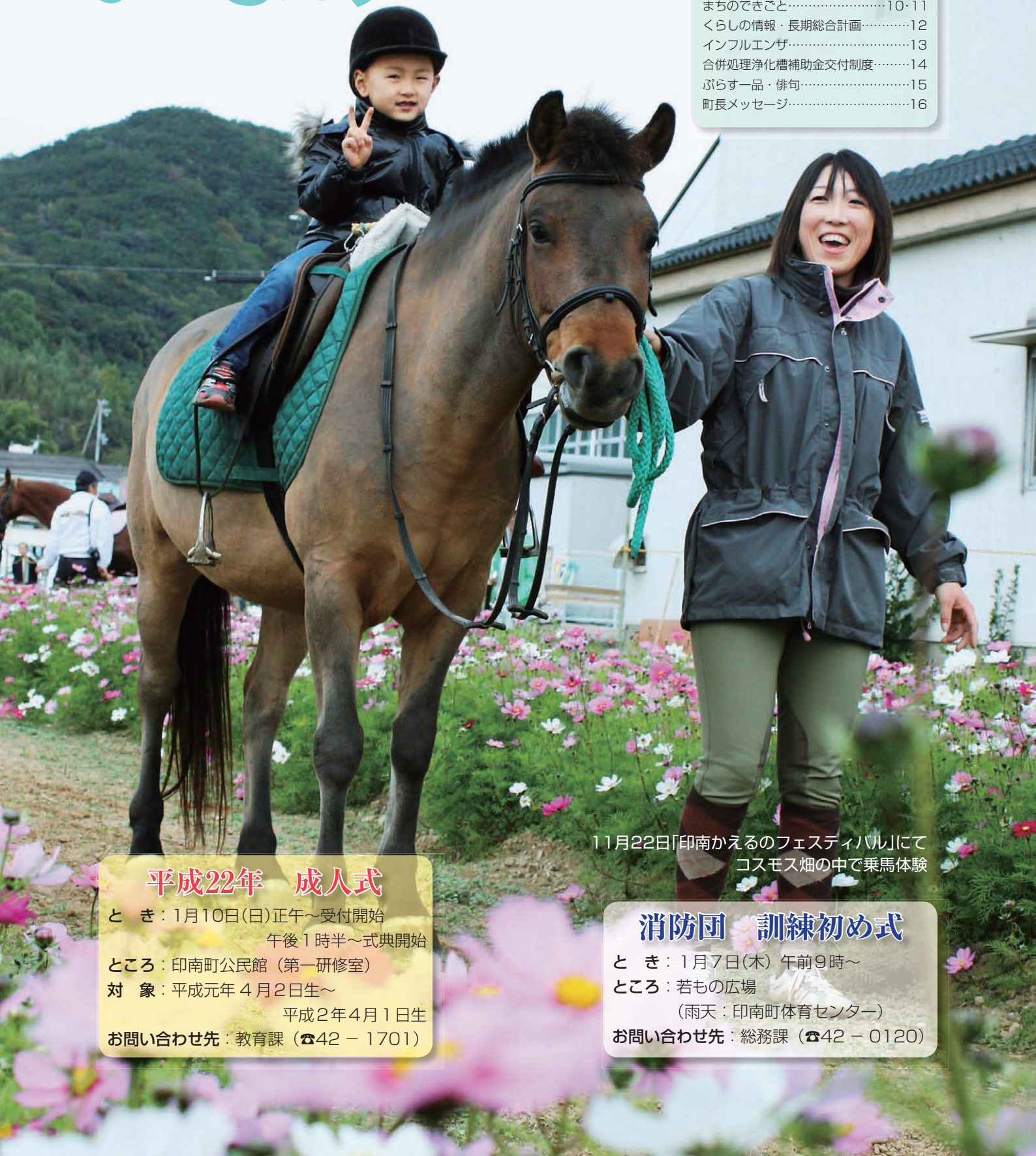
11月22日「印南かえるのフェスティバル」にて コスモス畑の中で乗馬体験