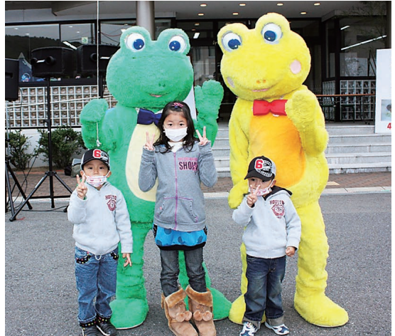
カックン、エルちゃんと一緒に記念撮影 ハイ、チ～ズ (*°▽°)V