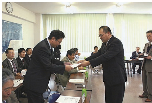
18名に委嘱状が交付されました。

今後とも計画審議会での審議の概要やアンケート調査結果などについては、広報「いなみ」や町役場ホームページにてご報告いたしますので、ご覧頂きますようお願いいたします。