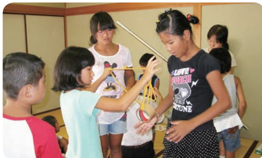
稲原教室の「マジック教室」