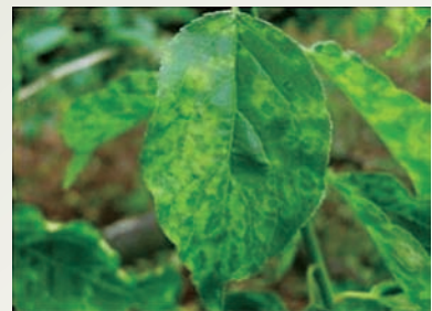
※植物防疫所より原図を提供されているため、無断転載禁止。