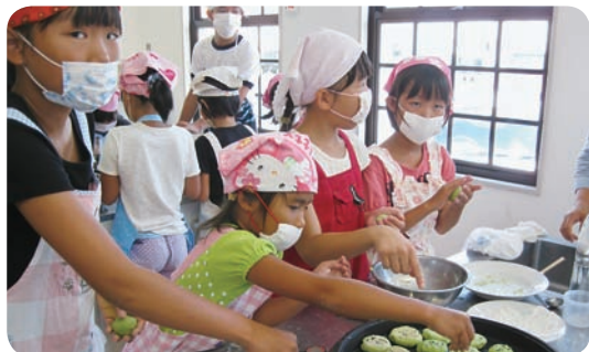
切目教室の「食育クッキング」