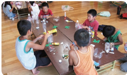
印南教室の「ペットボトル工作」

夏休み中、4小学校区において「夏休み放課後子ども教室」を実施しました。身近な素材を使った工作、地域の方を講師に招いての体験学習、食育学習等、様々な活動を行いました。