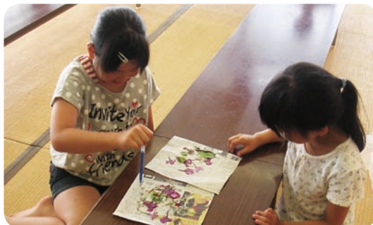
清流教室の「押し花作り」