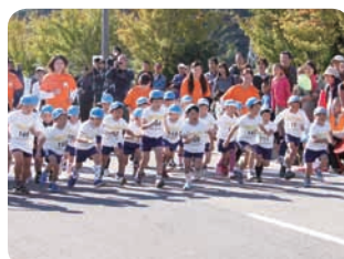
▲いなみこども園児スタート！