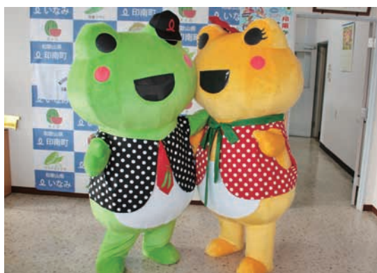
▲進化したカックくとエルちゃん、着用のベストは着替えもできてとってもおしゃれ。