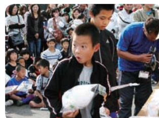
▲きいちゃんのぬいぐるみゲット！