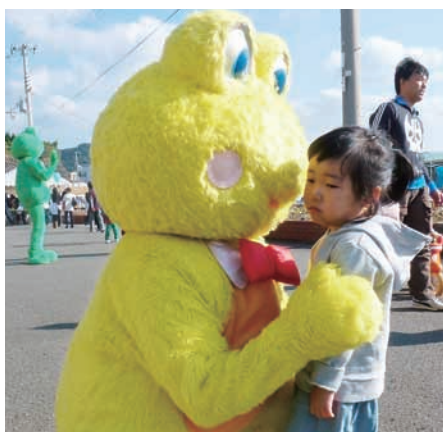
▲そんな人気者だったカックくん、エルちゃんも最近では子どもに微妙な反応をされることも…