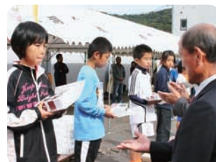
▲小学1～3年生の部表彰式