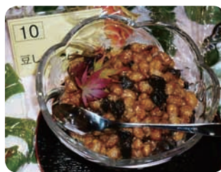
▲豆しかフレンドリ