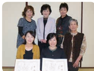
▲出場された皆さん