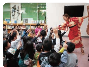
▲みわちゃんの紙芝居