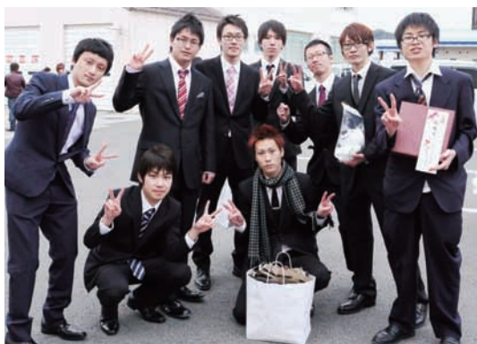
▶式典終了後の記念撮影