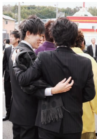
▶式典前に肩を抱き合って旧友との再会を祝う新成人