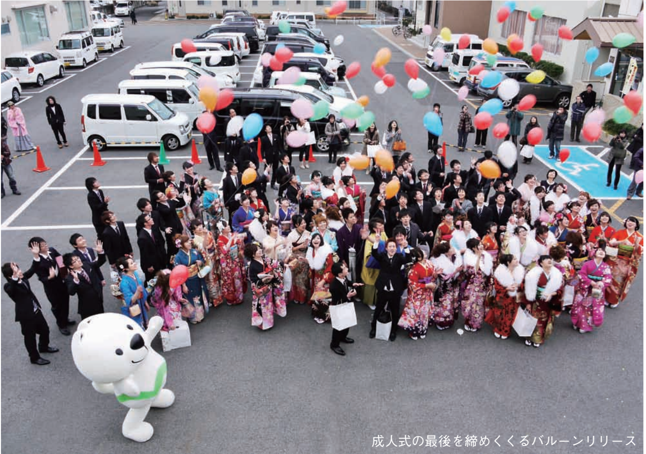
成人式の最後を締めくくるバルーンリリース