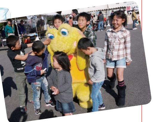
▲ エルちゃん大人気!