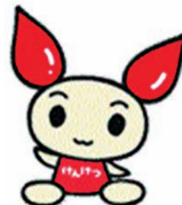
厚生労働省献血推進キャラクター 「けんけつちゃん」

200 mL 献血なら16歳から（献血の種類によって年齢基準が異なります）、健康な方ならば、献血による身体への影響はほとんどありません。しかし、体調を崩していたり、健康状態の良い時には献血をすると健康を損ねる場合もあります。