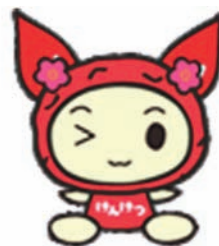
けんけつちゃん (紀州梅バージョン)

献血者が減少する冬期の輸血用血液の確保と医療機関へ安定的に血液製剤を供給するために皆様のご協力をお願いします。