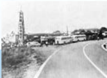
昭和30年代●国道42号に沿って光川地内