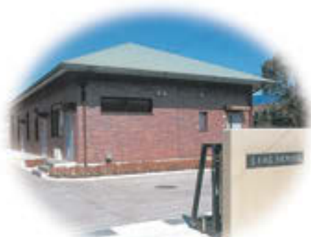
古井地区污水処理場