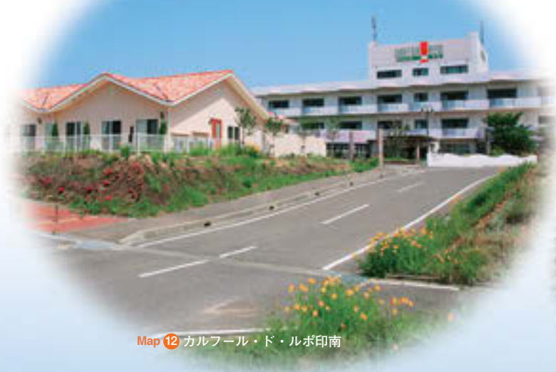
Map 12 カルフル・ド・ルポ印南