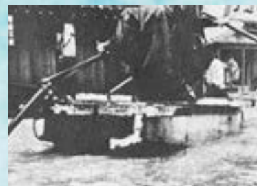
昭和37年7月●集中豪雨による浸水