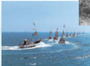
昭和62年11月●30周年記念イベント 「漁船パレード」