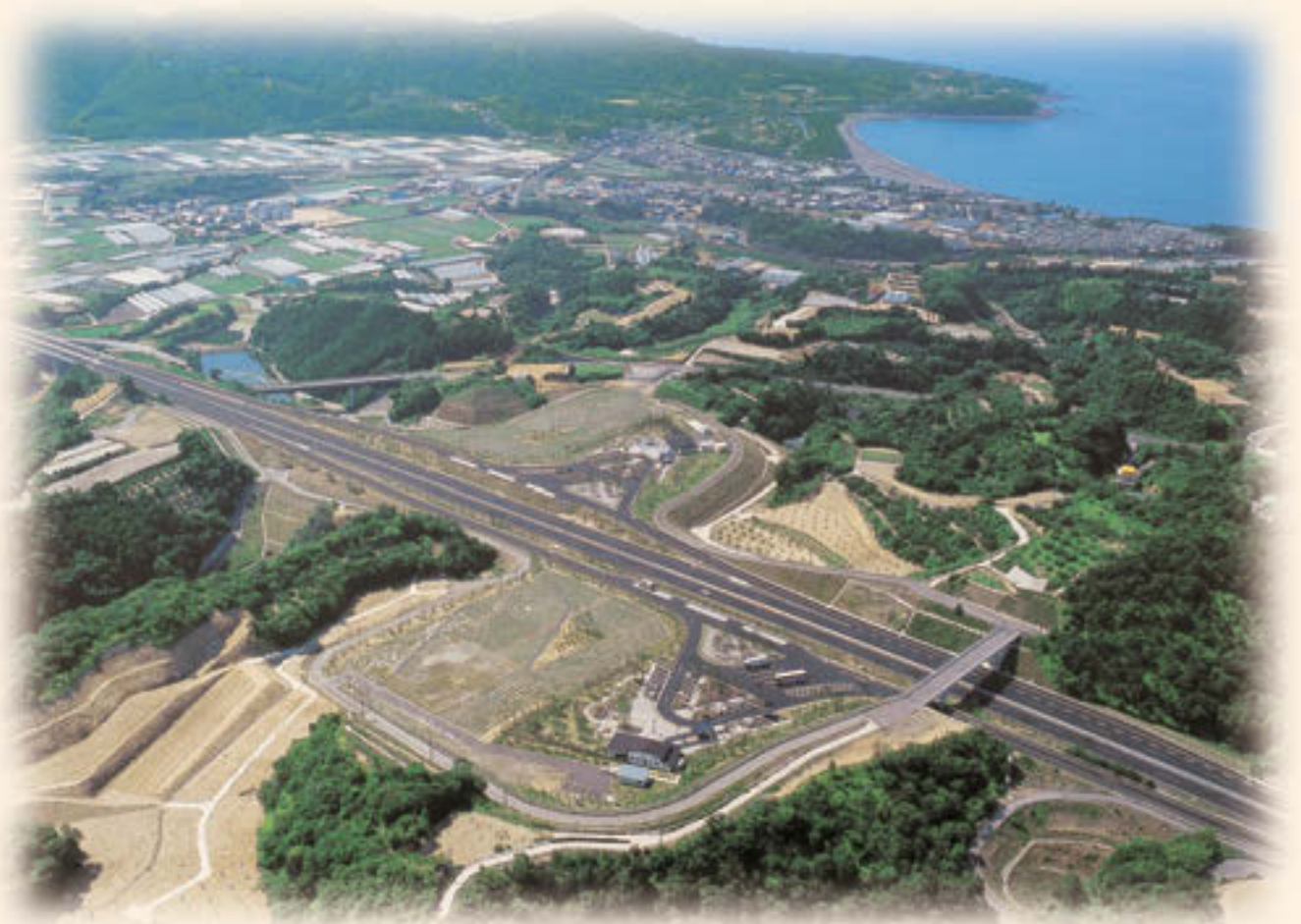
印南サービスエリア上空 から切目崎を望む