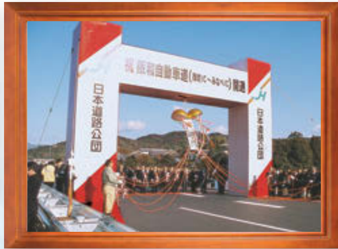
平成15年12月●阪和自動車道（御坊IC～みなべIC）開通