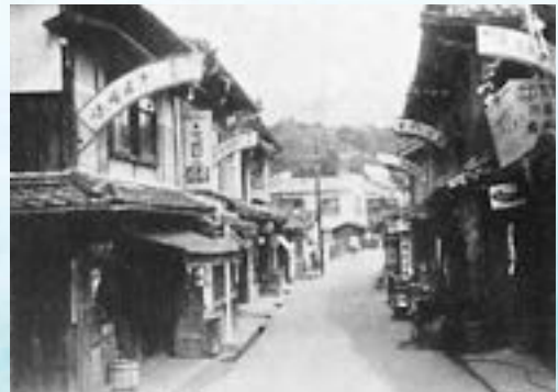
昭和30年代●印南商店街