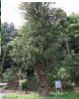
東光寺ナギノキ (県指定文化財)