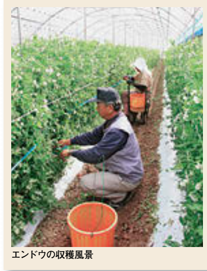
エンドウの収穫風景