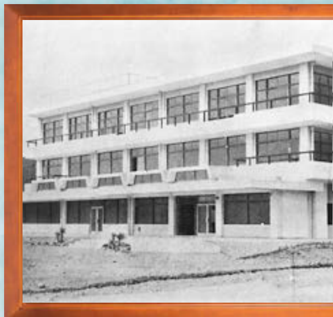
昭和39年●印南町役場庁舎