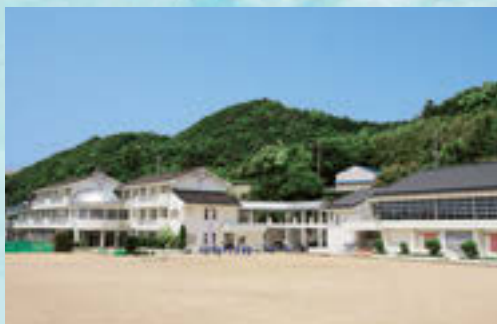
平成5年6月●印南中学校完成 Map 9