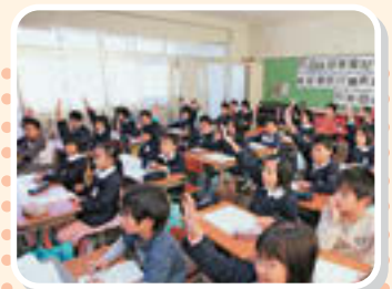
小学校の授業風景

本 町では、住民がいつでも、どこでも、だれでも学ぶことのできる生涯学習社会の実現に向けて、学習機会や学習内容の充実を図っており、幼児・学校教育はその基盤づくりと位置づけています。 また、住民の文化意識の高揚と地域文化の継承に努めているほか、人権の尊重、スポーツ・レクリエーション活動の振興、コミュニティ活動の