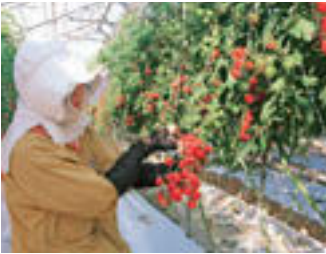
ミニトマトの栽培風景