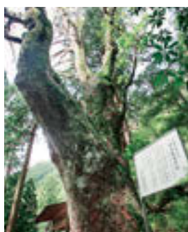
川又観音のトチノキ (県指定文化財)