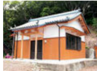
上から：Map ⑤ 印定寺 Map ⑥ 東光寺 Map ⑦ 畑峰(コンニャク)地藏

様、観音様を祀る小さな祠も各所に 見られ、素朴な民間信仰が今も息づ いていることに胸が打たれます。