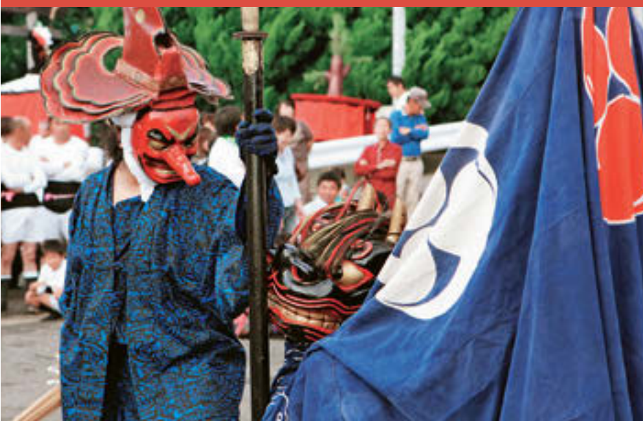
重箱獅子(県無形文化財) 東山口