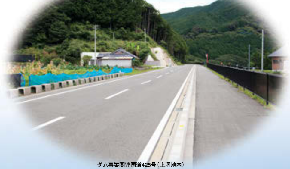
ダム事業関連国道425号(上洞地内)