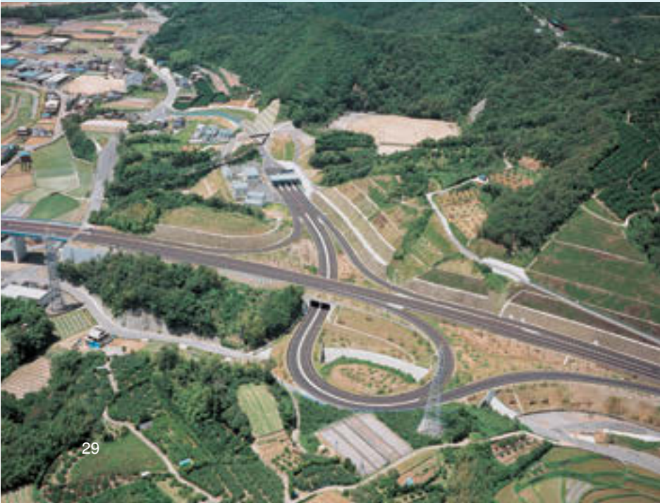
平成15年12月●印南IC完成