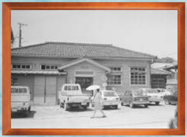
昭和30年代●印南町役場