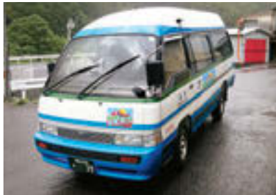
平成23年6月●印南町コミュニティバス運行開始