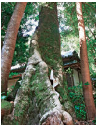
切目神社のホルトノキ (県指定文化財)

史跡や社寺、文化財は印南町の過去と現在を結ぶ縁 よすが 。遠い先祖の思いや祈り、営みを私たちに伝えてくれます。ひっそりとたたずむ小さな祠にも、病気の治癒や厄除けを願う素朴な民間信仰が息づいています。