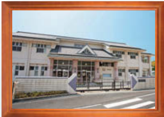
平成12年2月●稲原小学校完成 Map 10