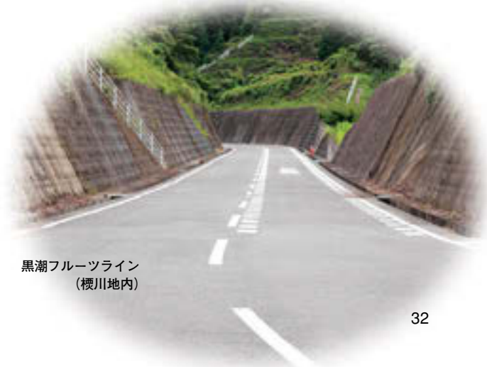
黒潮フルーツライン (櫻川地内)