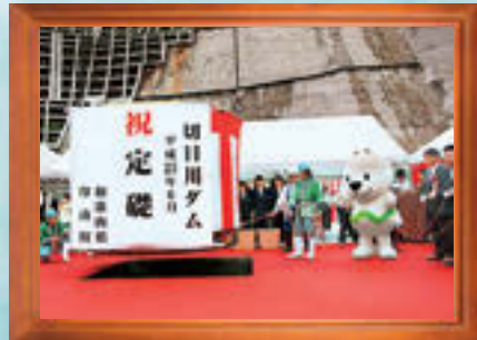
平成25年6月●切目川ダム定礎式