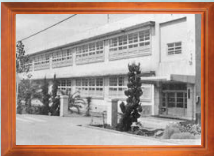
昭和39年3月●稲原西小学校完成