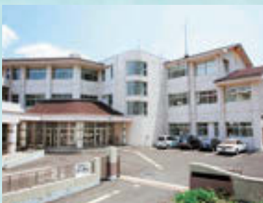
平成11年4月●清流中学校開校 Map 8