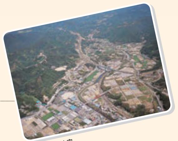
印南かえる橋上空

ま ちづくりは行政だけの力でできるものではありません。地方分権の時代においては、住民と行政が共通の目標を持ち、それぞれの役割と責任を理解し、互いに協力しながら、一体となって進めていくことが求められています。 このため、本町では、住民との対話に努めながら、各種団体や企業を含めた住民参加のまちづくりを促進、住民の町政への積極的な参画を図っています。 平成23年度には「新印南町行財政改革大綱」を策定し、時代にマッチした行政運営、健全な財政運営、広域行政の推進、情報化への対応などを掲げ、行財政運営の効率化、簡素化、合理化に努めています。