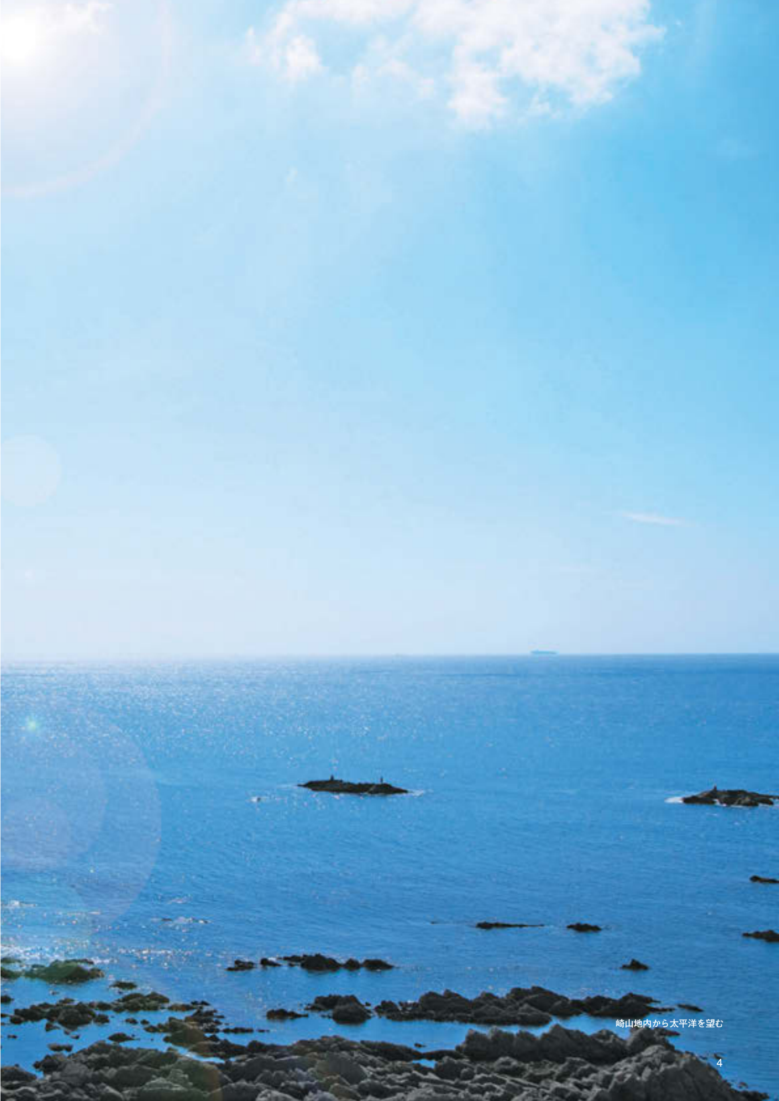
崎山地内から太平洋を望む