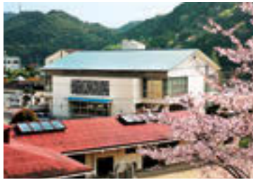
平成21年4月●清流小学校の開校 Map 13