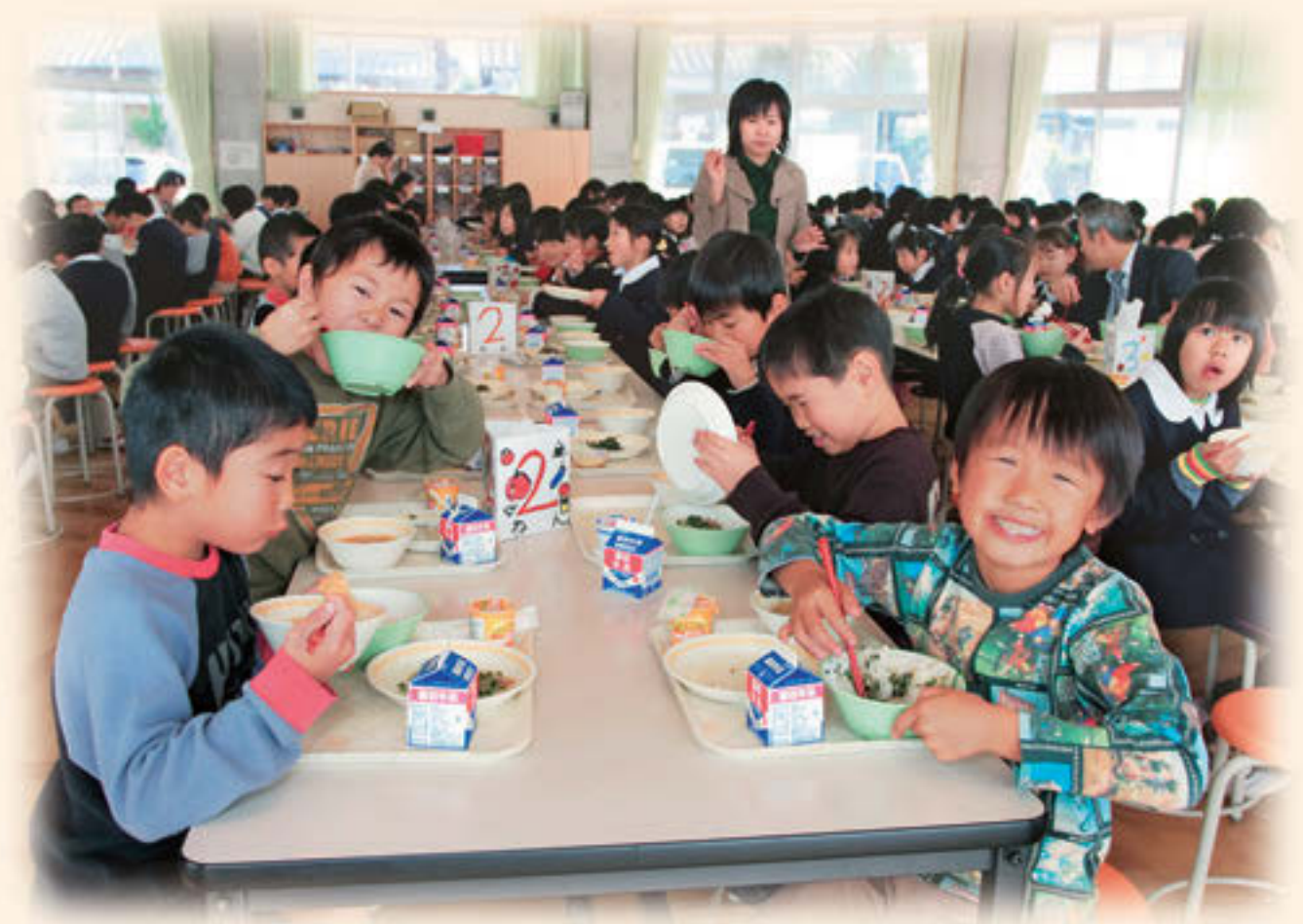
小学校の給食風景