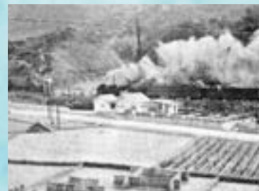
昭和30年代●印南簡易水道水源地附近