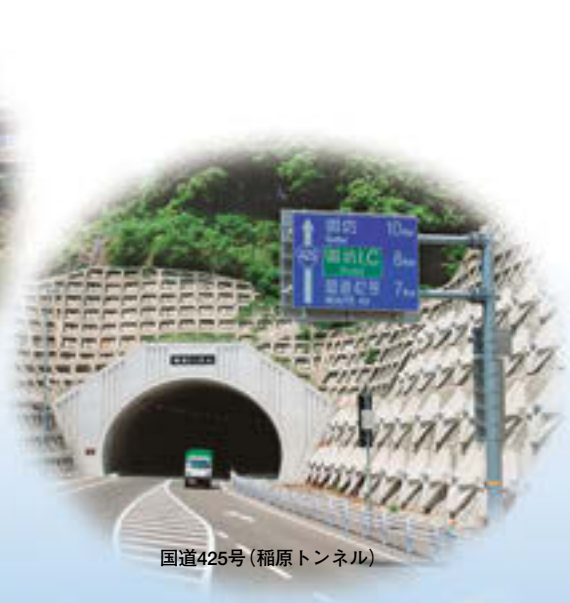
国道425号(稲原トンネル)