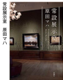
常設展示室 原田マハ