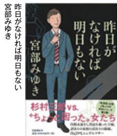
昨日か、なければ、明日もない 宮部みゆき