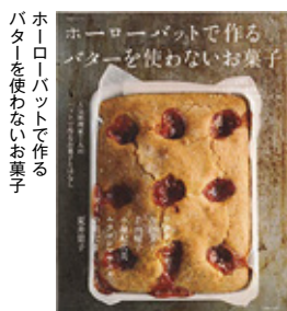
ホーローバットで作る パターを使わないお菓子