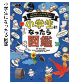
小学生になったら図鑑