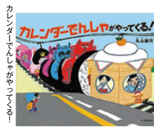
カレンダーでんしゃがやってくる!