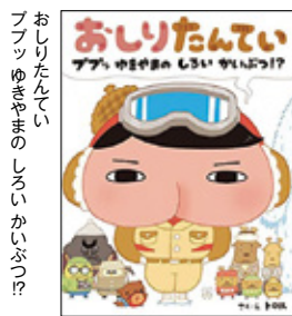
おしりたんてい ブーツゆきやまのしるいかいぞつ!?