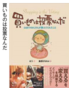
買ひものは投票なんだ