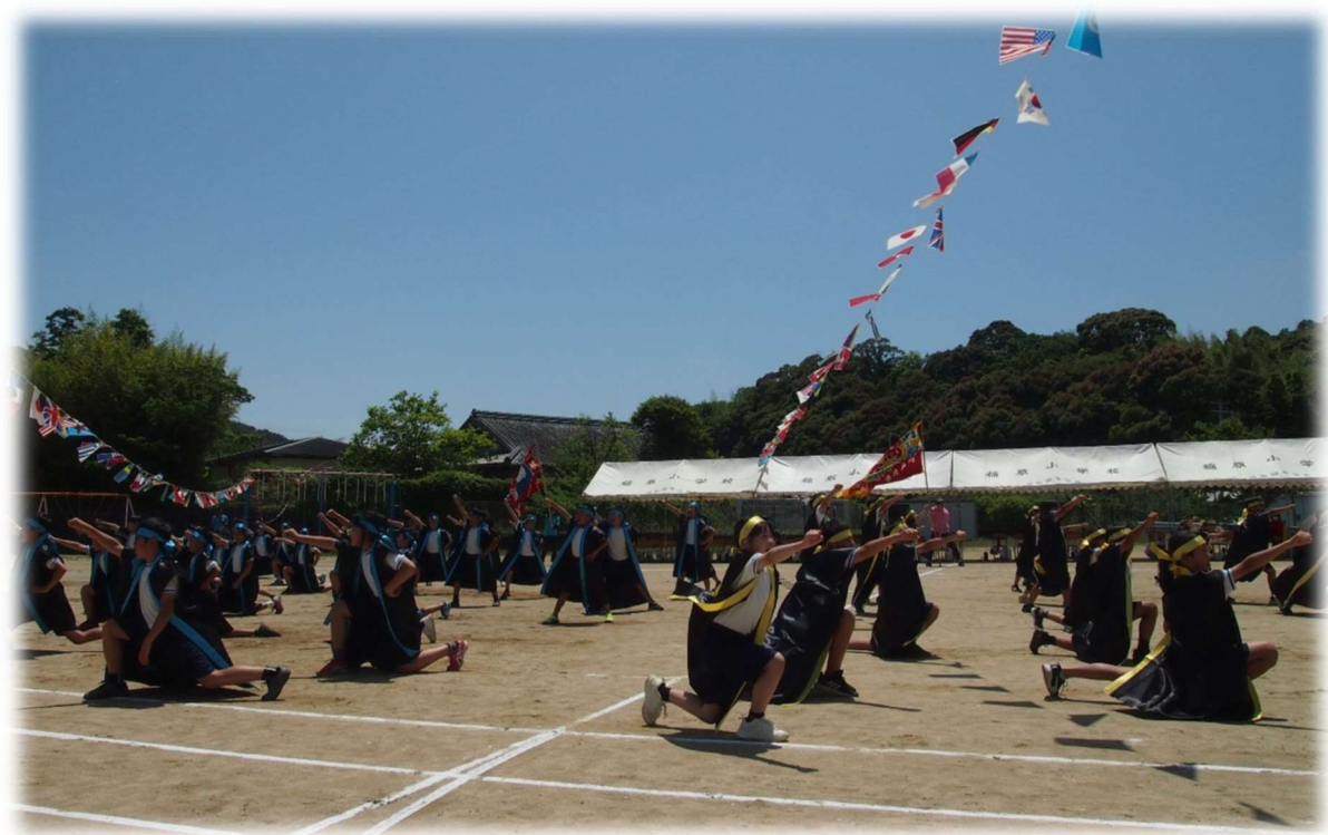
(稲原小学校運動会)