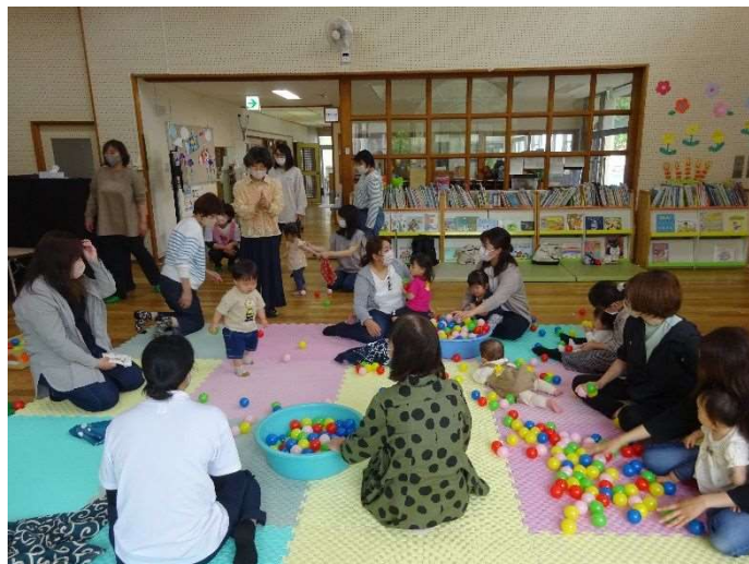
ひまわり教室（令和5年5月19日）

本町では、「ときめく子どもたちの未来のために」の基本理念のもとに「子育てするなら印南町」の実現を目指して、子育て支援・子育て環境の充実を図り、子どもを取り巻く家庭、地域が共に支え育ちあい、成長しながら、すべての子どもの笑顔が輝くまちづくりを推進します。家庭教育に関する学習機会の提供や子育てサークルの育成支援などを通して、生き活きと親子がふれあい、子どもが親に寄せる思いをしっかりと受け止められ、子どもへ注ぐ愛情を確かめ合えるよう進めます。また、基本的な生活習慣の確立と健康な身体の育成の大切さへの認識を深めるとともに、家庭の教育力向上を進めて行きます。