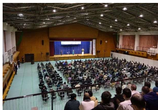
人権福祉講演会（令和5年2月24日）