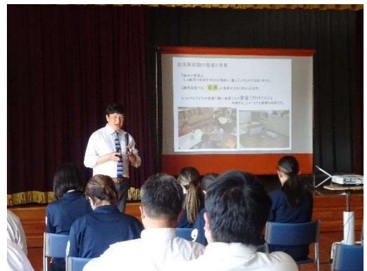
園小中連携事業に係る講演会（令和5年10月13日）