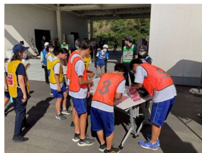
災害ボランティアセンター開設訓練 (印南中・令和5年9月1日)