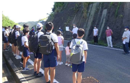
きりめっ子地域連携事業 (切目小中・令和4年9月3日)