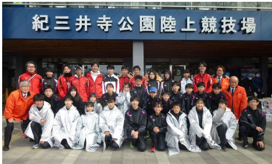
市町村対抗ジュニア駅伝競走大会（令和6年2月11日）