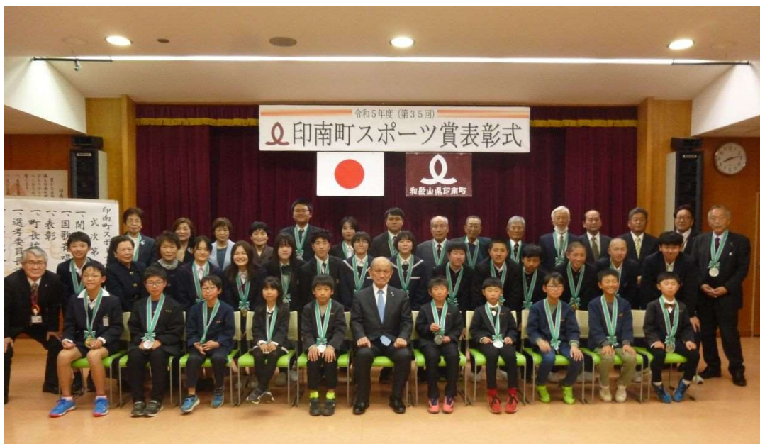
第35回スポーツ賞表彰式（令和6年3月26日）

文化に触れ合う機会の創出と情報発信の充実を図り、より多くの人に関心を持てるよう、学校教育や社会教育の場などを通じて、交流機会の創出に努めていきます。