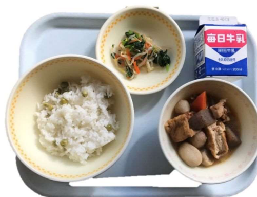
豆ごはん、甚太郎煮、梅肉和え、牛乳