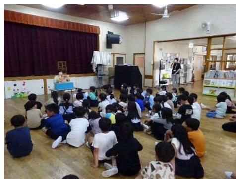
放課後子ども教室（令和5年5月17日）