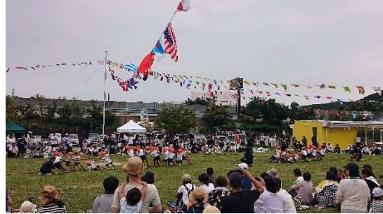
いなみこども園運動会（令和5年9月30日）