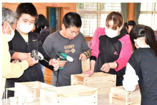
紀の国緑育推進事業（清流小・令和5年10月30日）