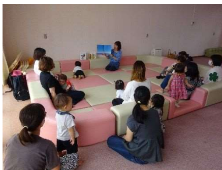
読み聞かせ（令和5年6月27日）