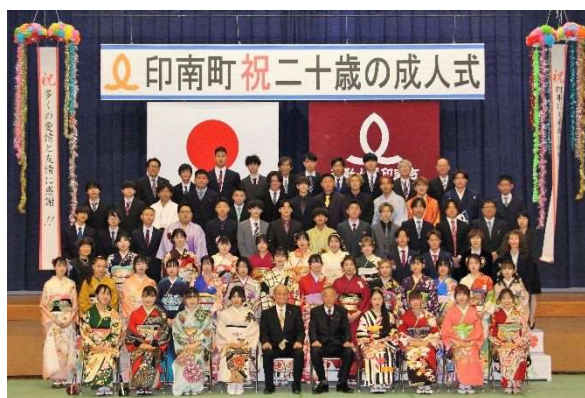
二十歳の成人式（二十歳の集い）事業（令和6年1月7日）