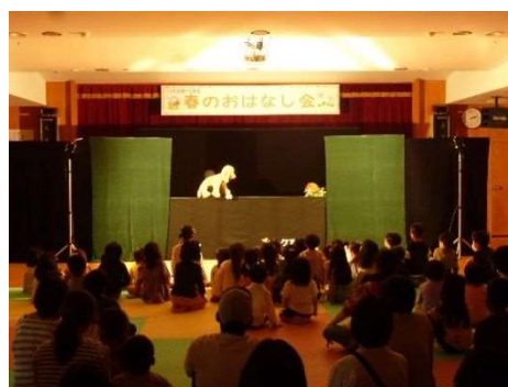
春のおはなし会（令和5年4月29日）