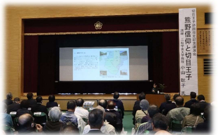
切目王子国指定記念イベントの様子