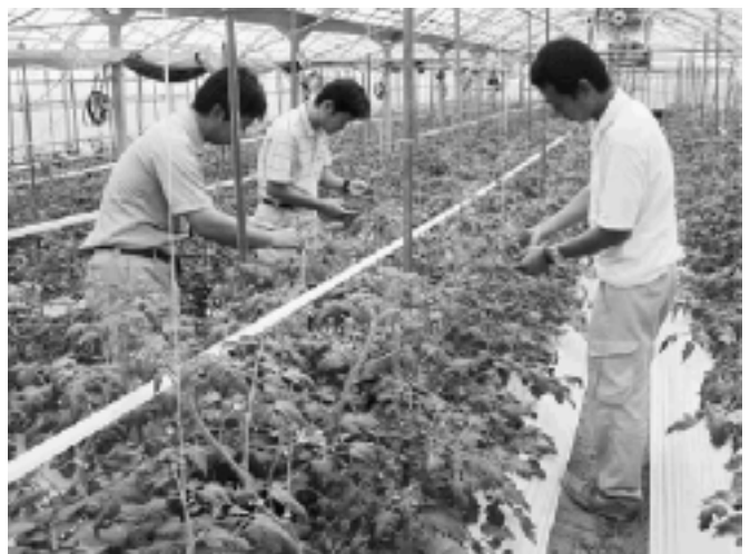
病状を調査する関係者

トマト黄化葉巻病をなくすには、害虫を駆除すると同時に、病気にかかったトマトの株を放置しないことが重要です。もし、病気にかかった株を放置するとこの害虫が増え、トマトやミニトマトの栽培ができなくなることもあり、関係者は、その拡がり状況が気になるようです。関係機関では、『ミニトマトの産地維持のため、協力を』と呼びかけています。