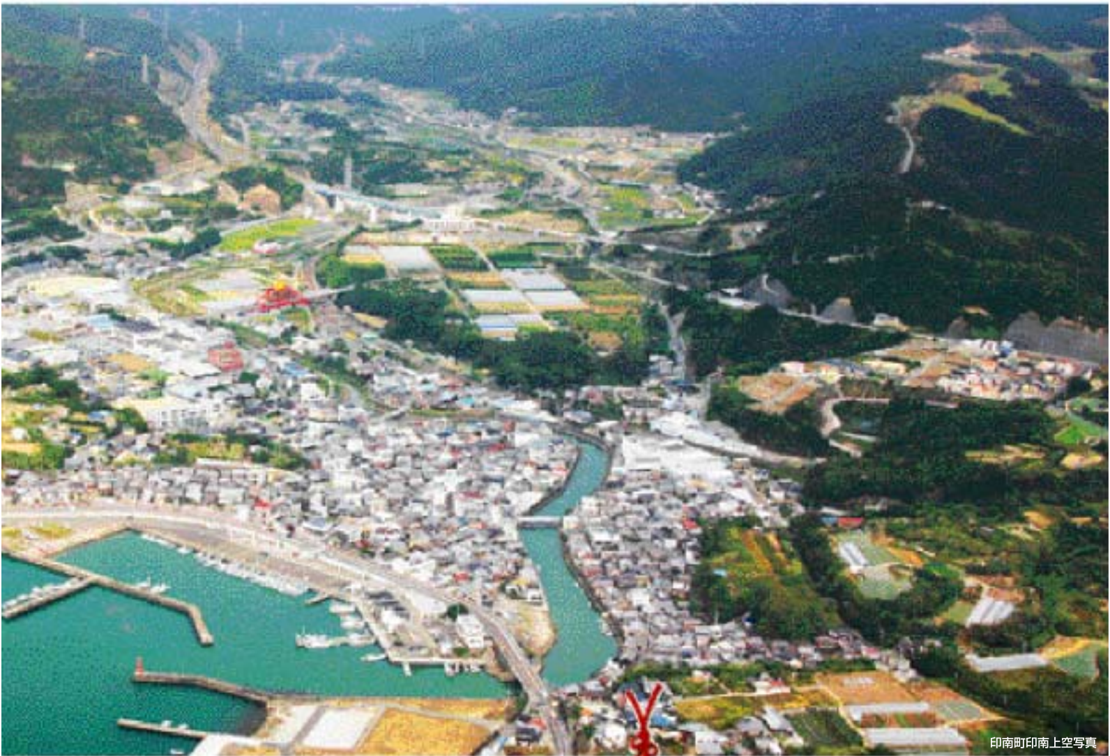
印南町印南上空写真