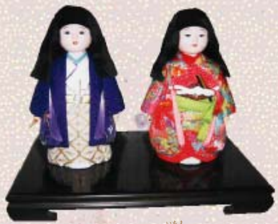
日本の伝統的な市松人形 (いあま 叢易子 作品)