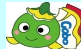
ハローワーク御坊マスコットキャラクター まめぴー