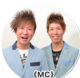
《MC》 兄弟お笑い芸人 すみたに